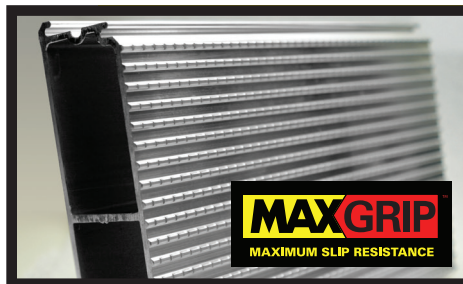
Plate-forme en aluminium MAX GRIP® EN OPTION

Le boulonnage de la plaque de rallonge et des marches par opposition à la soudure représente deux avantages importants : il évite les problèmes de corrosion et la peinture suite à la soudure et simplifie l'installation.