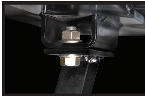
Plate de rallonge et marches boulonnées

Maxon a ajouté un espace (SmartSpace) entre le hayon élévateur et la plaque de rallonge. Cette caractéristique rend le hayon plus efficace et plus sûr d'utilisation.